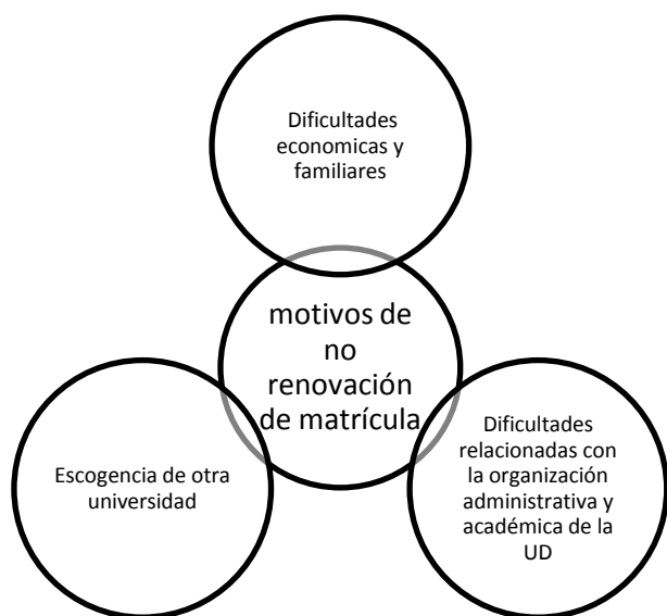
Gráfico 2. Motivos de no renovación de matrícula en la UD

El proceso de recolección de la información se llevó a cabo en varias etapas. Empezó con el diligenciamiento de un formulario virtual por parte de los estudiantes con las siguientes preguntas: “¿Cómo seleccionó e ingresó a la Universidad Distrital?”; “¿Cómo ha sido su vida universitaria?”; y “¿Qué ha sido lo más difícil de afrontar hasta el momento?” En el caso de los estudiantes retirados, se adicionó la pregunta “¿Cuál fue el motivo para no renovar su matrícula?” También se aplicó el formulario telefónicamente. Posteriormente se realizó un encuentro taller en el cual los estudiantes desarrollaron un ejercicio escrito que buscó conocer las experiencias relacionadas con la vida universitaria. De esta manera se determinaron las principales causas por las cuales se retiran los estudiantes y se muestran a continuación: