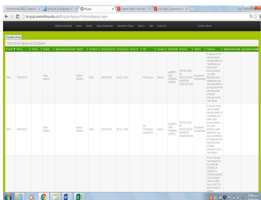
Fig. 2. En la figura se evidencia el seguimiento que tiene el estudiante y el profesional que lo atendió.

El estudiante tiene la certeza de ser atendido semanalmente a través de diferentes apoyos que brinda la institución. Hemos logrado fortalecer el acompañamiento a través de la herramienta y el estado actual, aquejaba continuamente los docentes que remitían los estudiantes y no tenían conocimiento del proceso. La plataforma brújula se ha convertido en la historia de vida y el ícono de la permanencia estudiantil.