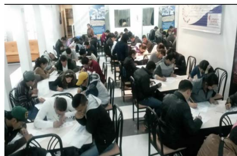
Imagen 2 Aplicación de prueba BADYG