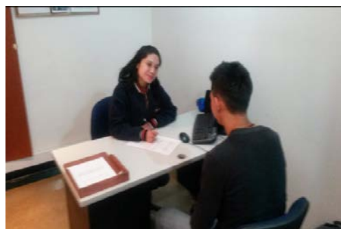
Imagen 1 Realización de entrevista

El objetivo de este proceso es: Identificar variables demográficas, académicas, psicológicas, sociales, económicas y de salud que puedan causar deserción o bajo rendimiento académico. También, se aplica la Batería de Aptitudes Generales y Diferenciales BADYG (ver Imagen 2) realizada por profesionales en psicología adscritos a Bienestar Institucional