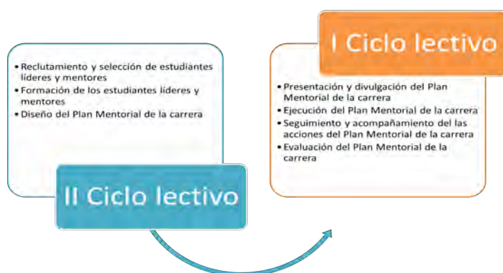
Figura 1. Etapas del proceso de tutoría, elaboración propia.

Dio lugar en el marco de una relación de cinco colaboradores, en la que intervienen las Orientadoras de Éxito Académico, el docente de enlace que puede ser: el subdirector, el coordinador de la carrera, el coordinador de primer nivel, el guía académico del nivel o algún profesor que la unidad académica asigne para el proceso, dos estudiantes líderes por carrera, los estudiantes Mentores que se asignan según la cantidad de estudiantes mentorizados que participan de la propuesta (1 mentor para 6 o 8 mentorizados) y los estudiantes mentorizados que son los estudiantes de primer ingreso. El proceso de mentorías se planificó en dos etapas (Fig. 1), la primera se desarrolló en el II ciclo lectivo, donde se realizó el reclutamiento de los mentores, y la segunda en el I ciclo lectivo donde se implementó el plan de mentorías.