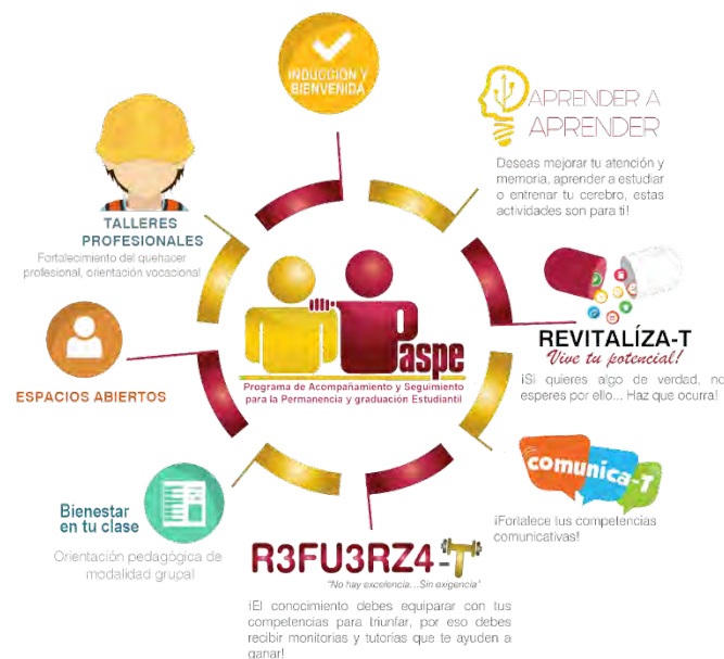
Imagen 1. Líneas de Intervención PASPE

Estas actividades, en términos de estrategias permiten articular diferentes líneas de intervenciones que favorecen la permanencia y graduación de los estudiantes, entre ellas encontramos: