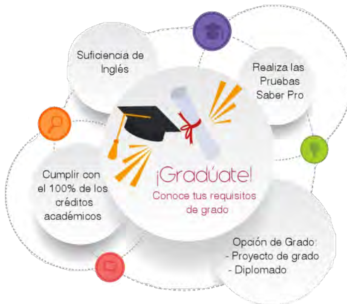
Imagen 3. Ruta de graduación PASPE