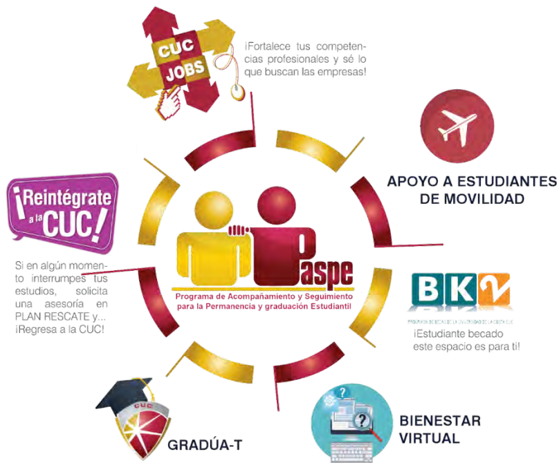
Imagen 2. Líneas de Intervención PASPE

Línea temática 4: Práctica de integración universitaria para la reducción del abandono (las tutorías-mentorías).