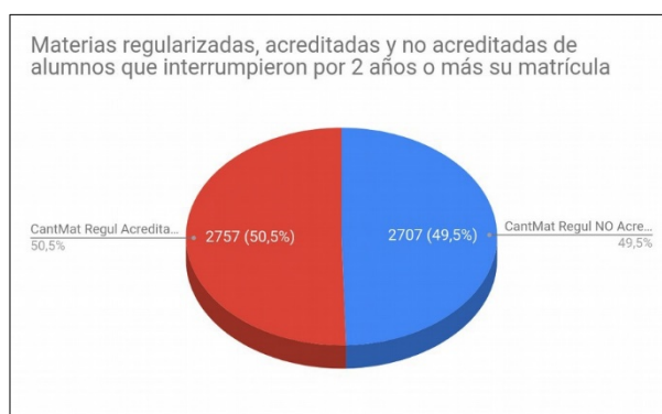
Figura 3: Alumnos que han interrumpido sus estudios

En un análisis más preciso, y considerando únicamente los casos en los que han interrumpido los estudios, se detecta que dichos alumnos cuentan con materias regularizadas sin acreditar (Figura 3).