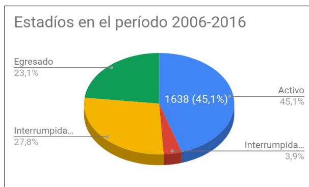
Figura 2: Porcentajes sobre alumnos activos, egresados y quienes interrumpieron sus estudios

De acuerdo al análisis que determina quienes interrumpieron su estudios, se observa que es un porcentaje significativo (Figura 2)