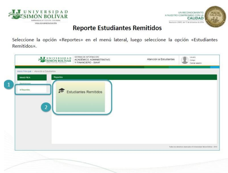
Fig 3. Módulo de atención a estudiantes: Reportes

En esta ventana se selecciona la opción de estudiantes remitidos y a continuación se muestra la siguiente ventana: