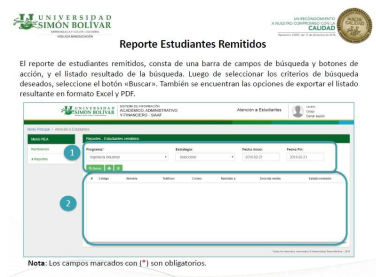
Fig 4. Módulo de atención a estudiantes: Reporte estudiantes remitidos

En esta ventana se selecciona la opción de estudiantes remitidos y a continuación se muestra la siguiente ventana: