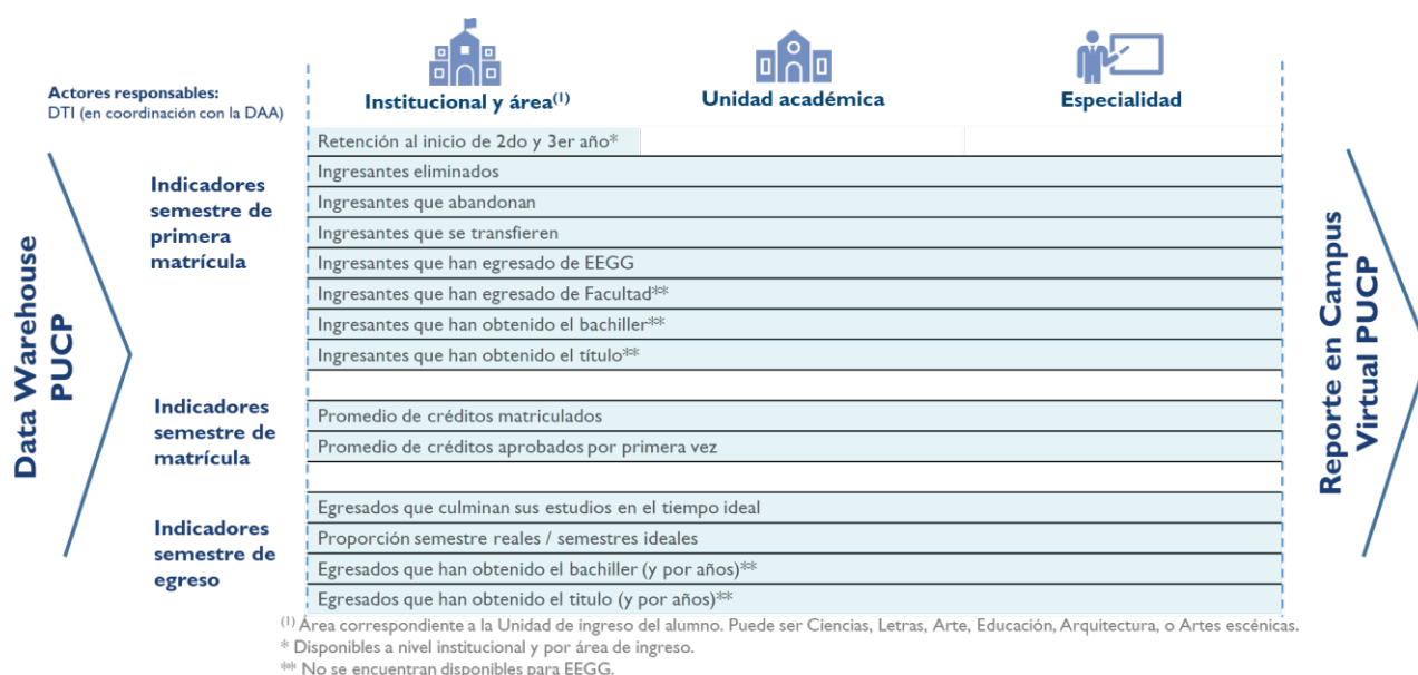
Figura2. Listado de indicadores institucionales sobre retención y culminación oportuna

Para ello, se definió un listado de 15 indicadores, los cuales se encuentran calculados a nivel institucional, de áreas de ingreso, de facultades y de especialidades.