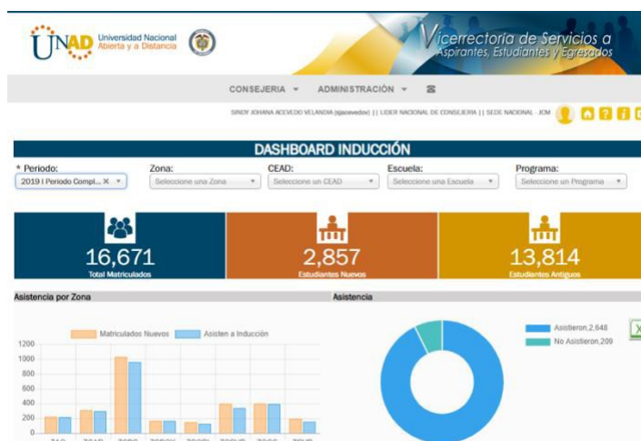
Ilustración 2. Sistema de Información VISAE

Esta herramienta facilita la gestión de todo el programa de inducción, desde la programación, inscripción del estudiante a las jornadas de inducción, registro de asistencia, monitoreo de participación y evaluación de satisfacción. Este proceso se encuentra articulado a la generación del acta de matrícula, de tal forma que el estudiante pueda conocer la información de manera oportuna.