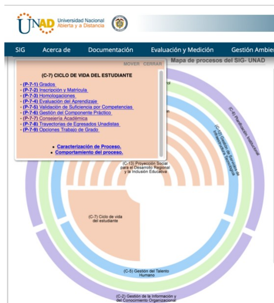
Ilustración 1. Gráfica del mapa de procesos SIG- UNAD

aquellos que apuntan al cumplimiento de la misión y visión de la Universidad, los resultados (productos y servicios) de estos procesos son recibidos por los usuarios de la Gestión Universitaria, estudiantes, egresados y demás beneficiarios. Estos procesos desarrollan sus diferentes actividades teniendo en cuenta los lineamientos que dan los procesos estratégicos y soportando su gestión con los procesos de apoyo (UNAD, 2019).