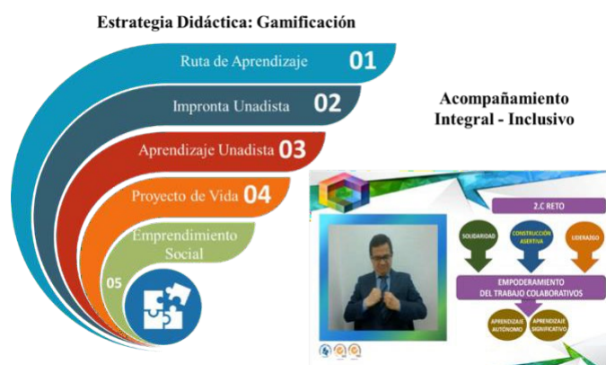
Ilustración 6. Estrategia Didáctica Cátedra Unadista.

En este sentido la Cátedra Unadista, en articulación con los lineamientos académicos de la VIACI viene consolidando los escenarios de acompañamiento docente, desarrollado por el consejero académico, como son los b-learning y los encuentros sincrónicos mediados por las TIC (web conference).