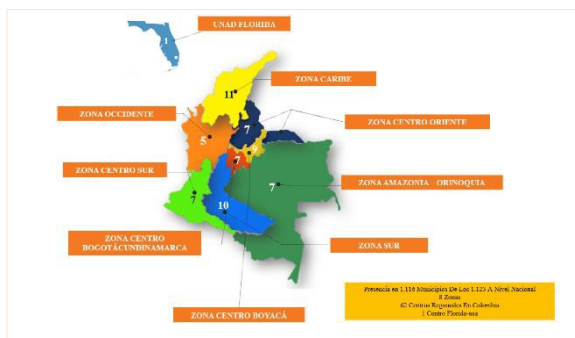
Figura 1. Presencia de la UNAD