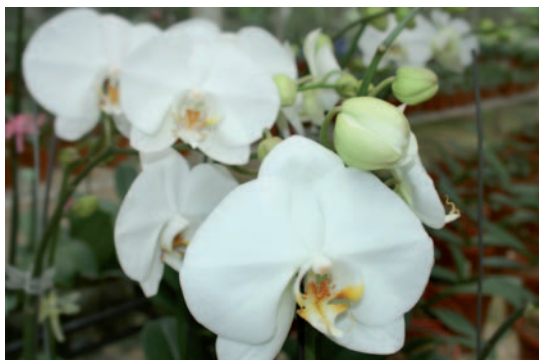
La Flor del Espíritu Santo, uno de nuestros símbolos patrios.

Taiwán al rescatar la Flor del Espíritu Santo, se contempla donar estas plantas a personas, instituciones educativas, asociaciones de productores, parques nacionales, fundaciones protectionistas y grupos conservacionistas sin fines de lucro, que estén interesados en la conservación y cuidado de nuestra Flor Nacional.