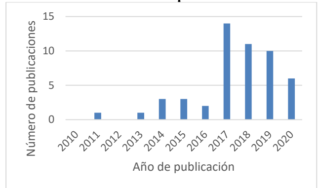
Figura 2. Distribución de publicaciones por año.

En la figura 2 se aprecia la distribución de publicaciones en el período 2010-2020. El gráfico al momento demuestra que a partir del año 2017 se presentó