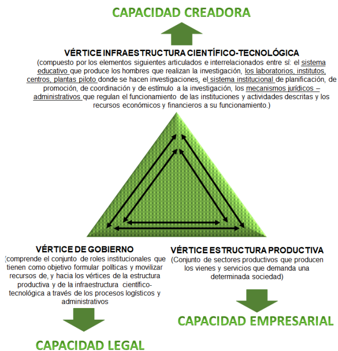
Figura 1. Triángulo de Sábato.

El modelo surge en Argentina en las décadas de los '60 y '70. Postula que, para que exista un sistema de ciencia-tecnología es necesario el gobierno (promotor, diseñador y ejecutor de la política), la infraestructura de ciencia y tecnología (proveedor de conocimiento y tecnología) y el sector productivo (representa el lado de la demanda del conocimiento y tecnología), estén fuertemente interrelacionados [41] (Figura 1).