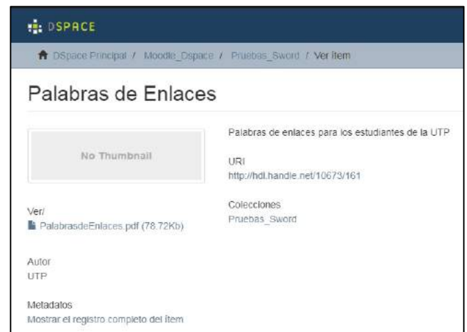
Figura 2. Carga exitosa del documento al repositorio de prueba mediante la plataforma de Moodle.

Se procede a cargar el archivo directamente al repositorio, como se muestra en la figura 2.