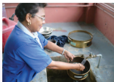
Porcentaje más fino que el Tamiz # 200

Con las siguientes figuras podemos ilustrar algunos de los interesantes aspectos y actividades basados en ensayos que realizamos a los agregados en este laboratorio: