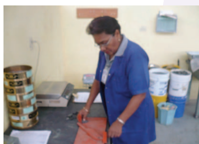
Partículas Planas y Alargadas

La Figura 3 , indica la prueba de Los Ángeles, que nos permite determinar la resistencia al desgaste por rozamiento de los agregados.