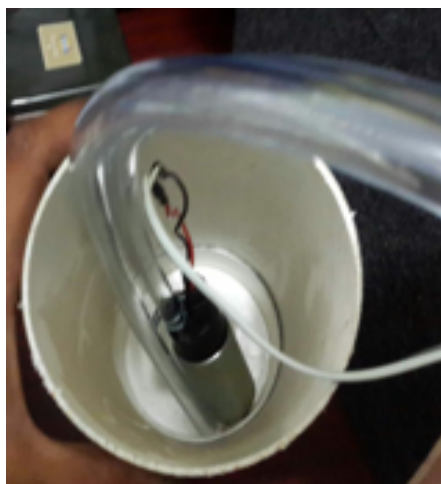
Figura 2. Bomba y reservorio de agua residual.

En la figura 2 se presenta una imagen con la bomba sumergible, las tuberías y el reservorio para el efluente.