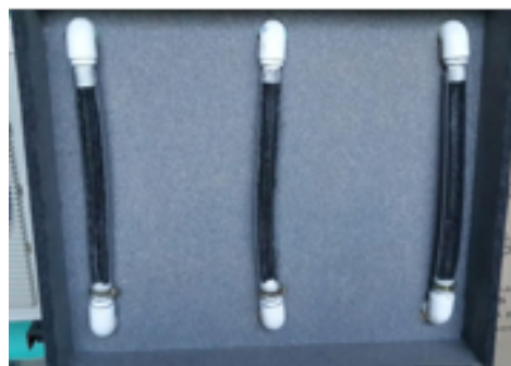
Figura 3. Prototipo construido (a) parte posterior y (b) parte frontal.