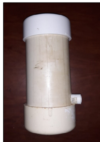
Figura 4. Filtro de carbón.

Para la limpieza del filtro se realizó un cambio, tanto del algodón como el carbón vegetal y otra opción sería el lavado del carbón y reemplazo del algodón [5].