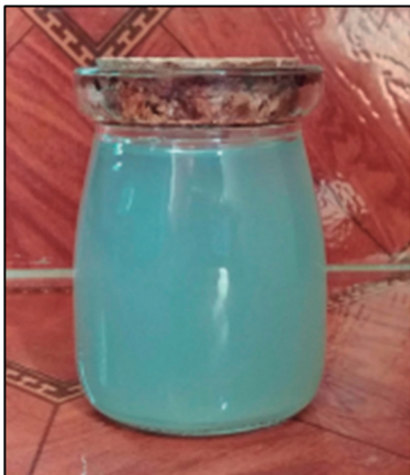
Figura 6. Agua residual almacenada.

Como resultado después de los procesos por los que pasa el agua residual de coagulación, floculación y filtrado; se obtiene el agua limpia sin residuos que será reutilizada.