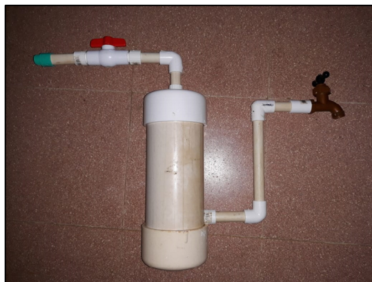
Figura 5. Tubería de transporte del agua.

El transporte del agua desde el tanque de almacenamiento de agua residual hasta el filtro y del filtro a la llave, se dio a través de tubos PVC de 1/2".