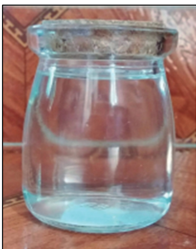
Figura 8. El agua luego de ser filtrada y lista para ser reutilizada.