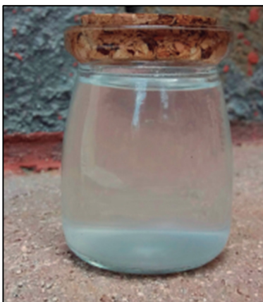
Figura 7. El agua luego del proceso de coagulación/floculación.