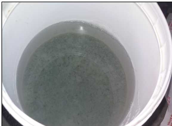
Figura 3. Sedimentación de los residuos.

Se deja sedimentar, luego del mezclado del agua con el coagulante, aproximadamente 30 a 60 minutos.