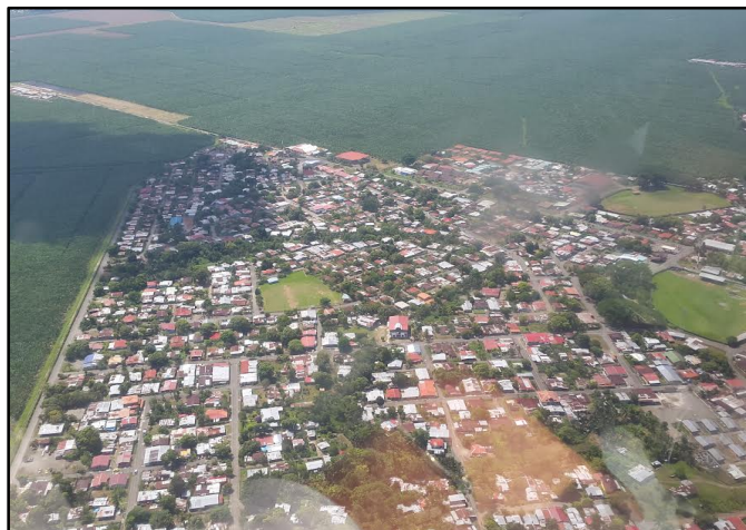
Figura 1. Distrito de Changuinola [13].

El estudio se desarrolló en el distrito de Changuinola, Provincia de Bocas del Toro, República de Panamá. El mismo fue creado el 17 de abril de 1970 y cuenta con una extensión de 4,040 kilómetros cuadrados (figura 1). Su nombre, según los historiadores, se deriva de los indios "Changuinos", que habitaron la parte occidental de la provincia, de allí también se deriva el nombre del río que lleva el nombre del Distrito. Esta tribu al igual que otras desapareció paulatinamente como consecuencia del maltrato brindado por los conquistadores y otros por las enfermedades traídas por ellos [12].