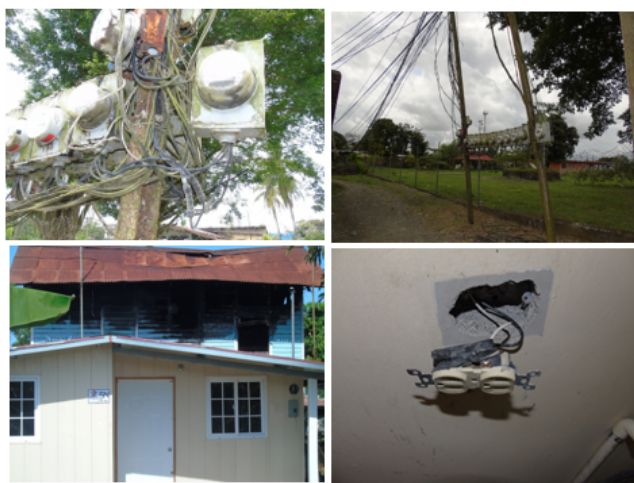
Figura 5. Instalaciones eléctricas en muy mal estado en algunas viviendas del distrito de Changuinola, Provincia de Bocas del Toro.

En otras viviendas de estatus económico medio si cuentan con los equipos de protección eléctricos, en donde se puede decir que la seguridad eléctrica en esas viviendas es adecuada para sus habitantes, por lo tanto, se reduce el porcentaje de accidente causado por una mala instalación eléctrica.