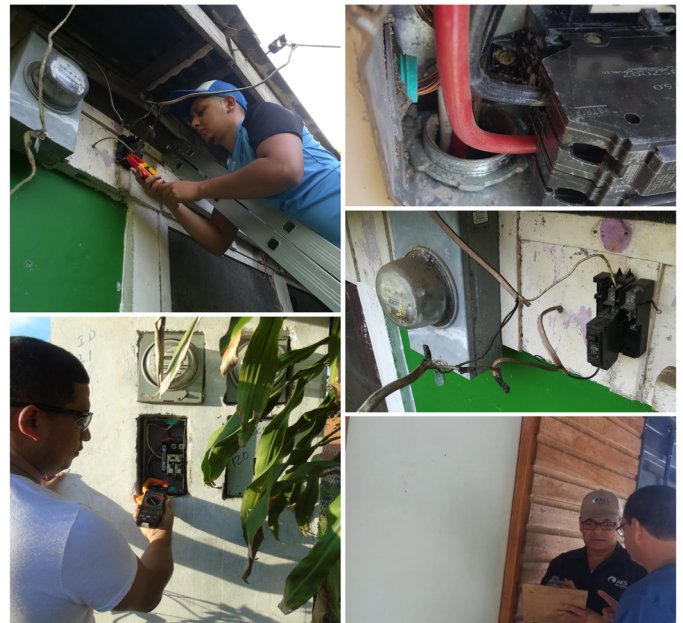
Figura 4. Verificación de la instalación de las viviendas en el distrito de Changuinola, Provincia de Bocas del Toro.

Se resume que por varios factores la seguridad eléctrica en residencias depende de la economía, desconocimiento de las personas y malas prácticas de electricistas irresponsables de su ética. Se evidenciaba que en algunas viviendas no tenían los conductores puestas a tierra, protección de sobrecorriente, correcta puesta a tierra y dispositivos de protección de corto circuito, ya que esto tiene un costo elevado. La población indica que no lo usan y no lo tienen por su alto costo (figura 5).