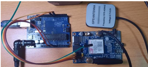
Figura 4. Arduino Uno, Moduló SIM 808 y antena GPS.

La Rapsberry Pi al detectar el mensaje SMS recibido del Arduino, procesa la información de las coordenadas a un formato de latitud y longitud, y establece una conexión remota a un servidor en la nube con MySQL, enviando la información del paciente como: nombre, teléfono, fecha, y las coordenadas GPS.