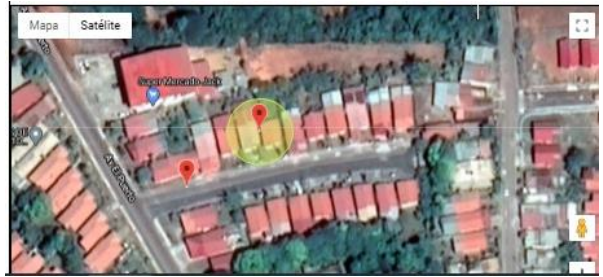
Figura 5. Vista de la movilidad del dispositivo en Google Maps

El prototipo fue validado en cuanto al funcionamiento de cada una de las piezas conectadas, se realizó un análisis de los datos enviados, obteniendo los siguientes resultados: La captura de datos GPS se realizó en intervalos de tiempo de 10 segundos. Durante ese tiempo el módulo se encuentra a la escucha de una instrucción del servidor. Al completar el tiempo de espera comienza la tarea de capturar los datos del GPS, el proceso toma aproximadamente un segundo, y realiza esta rutina como mínimo 10 veces antes de enviar los datos.