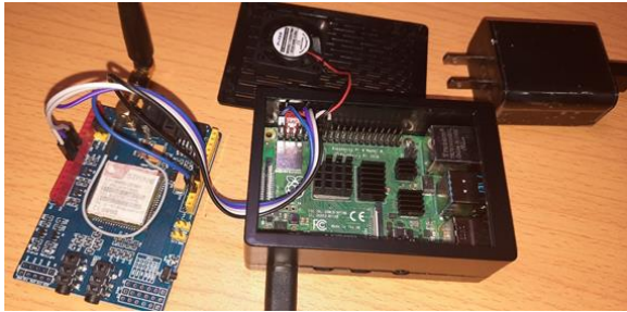
Figura 3. Raspberry Pi y Moduló SIM 900.

Los resultados obtenidos es el diseño de un prototipo que permite monitorear la localización de un paciente, a través de acceso remoto SMS. Se tiene una Raspberry pi conectado a un módulo SIM 900 que funciona como servidor, que envía un mensaje de texto a un Arduino Uno conectado a modulo SIM 808 (cliente). Este mensaje contendrá una palabra clave para que el Arduino reconozca que debe contestar con las coordenadas GPS de la SIM, como se muestra en las figuras 3 y 4.