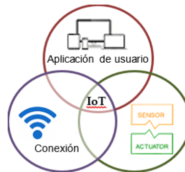
Figura 1. Concepto de IoT.

Los avances que ha tenido el IoT y la computación en la nube, en diversos sistemas de monitoreo, ha permitido considerar su arquitectura en este prototipo, gracias al protocolo de Internet (IP), el cual especifica el formato técnico de los paquetes y el esquema de direccionamiento para que los dispositivos utilizados se comuniquen y transmitan los datos necesarios. [5]. El IoT consiste en una combinación de sensores y actuadores capaces de proporcionar y recibir información digitalizada y colocarla en redes bidireccionales que transmiten los datos para ser utilizado en aplicaciones de usuarios, [5] como se muestra en la figura 1.