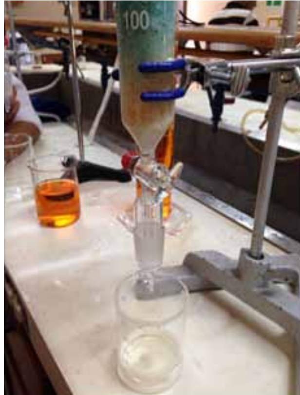
Figura 7. Tratamiento de efluente con azul de metileno.

Al probar con compuestos inorgánicos se observa un resultado más efectivo ya que estos presentan enlaces iónicos que son más fáciles de romper, lo que da una filtración más rápida que conlleva solo una etapa.