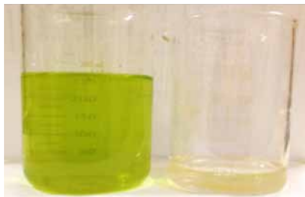
Figura 4. Resultados obtenidos del tratamiento de efluentes conteniendo clorofila.

Entre los orgánicos se utilizan sustancias como la sangre y la clorofila dando como resultado la remoción del pigmento como se muestra en las siguientes figuras.