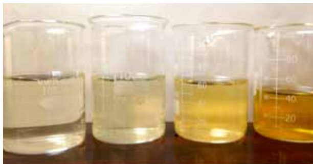
Figura 2. Etapas del residuo de la limpieza de las escamas (biofiltro).

El proceso de lavado de las escamas se realizó a base de agua. Una vez pulverizadas y colocadas en el embudo de separación cilíndrico, se le vierte agua al filtro, para que éste suelte su color natural y quede libre de cualquier colorante no deseado, y se pueda filtrar las diferentes soluciones de la manera correcta y más eficiente. El lavado se realizó hasta observar que en el agua de lavado final estuviera lo más transparente posible. En la fotografía de la Figura 2 a continuación, se observa una secuencia de diferentes coloraciones del agua proveniente del lavado de las escamas pulverizadas.