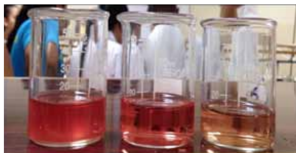
Figura 5. Resultados obtenidos del tratamiento de efluentes para la remoción de pigmentos orgánicos animales.

Como se puede observar en la figura a continuación, el biofiltro construido fue capaz de remover pigmentos orgánicos vegetales en una única etapa, es decir, no fue necesario un re-filtrado posterior, situación que sí fue necesaria en el tratamiento de efluentes con pigmentos orgánicos animales, como se muestra en la figura a continuación.