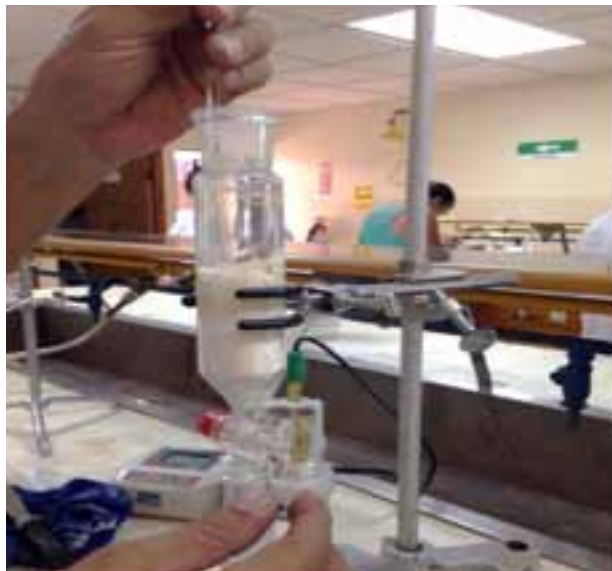
Figura 1. Confección manual del biofiltro.