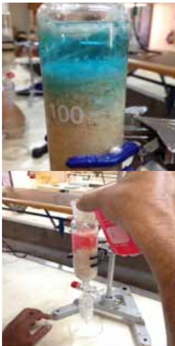
Figura 3. Tratamiento de efluentes sintéticos con azul de metileno y con sangre.

Las observaciones preliminares dieron como resultado la degradación y retención de las partículas de pigmentos en las partículas de escamas. Esto se debe a la propiedad que tienen las escamas como medio adsorbente, ya que las escamas poseen un polímero llamado quitina la cual es un compuesto cuya principal función en la naturaleza es estructural, es decir que forma parte esencial de tejidos que dan soporte y protección al cuerpo del organismo.